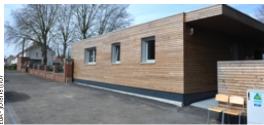
Bardée de bois, l'extension modulaire s'intègre parfaitement au quartier.

Le quartier de Seuris jouit déjà d'une première crèche et d'une école maternelle. « Avec cette extension, nous en avons fait un vrai pôle de la petite enfance » conclut le bourgmestre. ■ P.W.